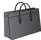
8. (サラリーマンの) かばん